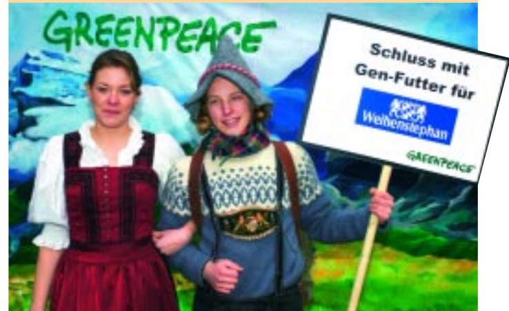
Greenpeace-Proteste gegen Gen-Pflanzen im Tierfutter

Greenpeace fordert von allen Herstellern tierischer Produkte, dass die Tiere ohne Gen-Pflanzen gefüttert werden. Bei Stichproben deckte Greenpeace Gen-Soja im Futtertrog von Milchkühen auf, aus deren Milch die Müllerprodukte hergestellt wer-