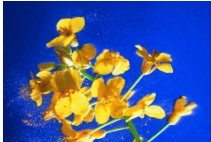
Pollenflug durch Wind und Insekten macht nicht an Ackergrenzen Halt.

Einmal in die Umwelt gesetzt, sind Gen-Pflanzen nicht mehr rückholbar und breiten sich unkontrolliert aus. Etwa durch Pollenflug oder Insekten gelangt das veränderte Erbgut in herkömmliche Pflanzen. In Kanada hat sich Gen-Raps über Pollenflug fast flächendeckend ausgebreitet. Viele Ökobauern mussten den Anbau von Raps daher aufgeben. Ähnlich ist die Situation für Konsumenten. Wenn Gentechnik einmal Fuß fasst, werden Gen-Pflanzen sich auf unseren Äckern ausbreiten. Dann gibt es keine Wahl mehr: weder für Verbraucher noch für Landwirte.