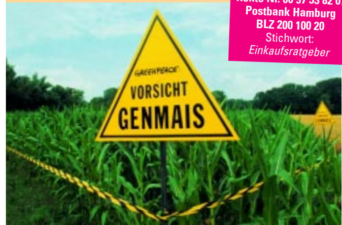
Greenpeace markiert Felder mit Gensaaten und warnt vor den Risiken.

Damit Greenpeace weiterhin aktiv sein kann, freuen wir uns über jede Spende: Konto Nr. 00 97 33 82 07 Postbank Hamburg BLZ 200 100 20 Stichwort: Einkaufsratgeber