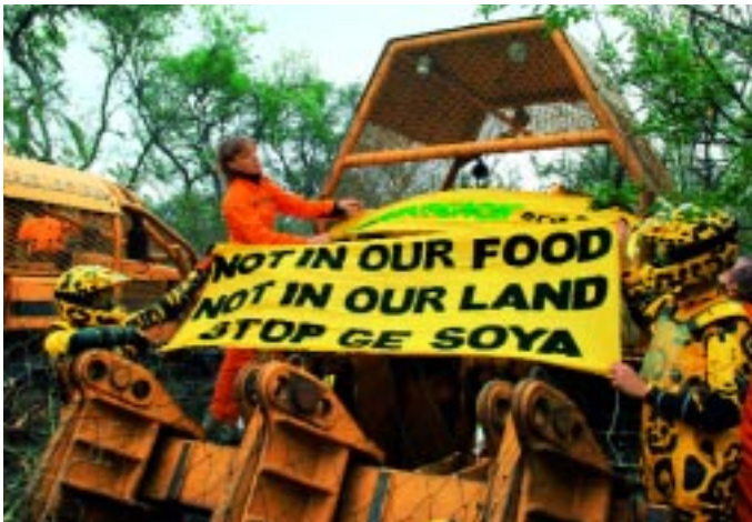
Protest gegen Urwaldzerstörung für Sojaanbau in Argentinien

tungsmittel Roundup der Gen-Firma Monsanto gemacht wurde. Greenpeace fordert: Soja nur gentechnikfrei und nicht aus Urwaldzerstörung! Und für den Verbraucher: Wenn Sie auf Fleisch nicht verzichten möchten, bevorzugen Sie Fleisch aus ökologischer Produktion.